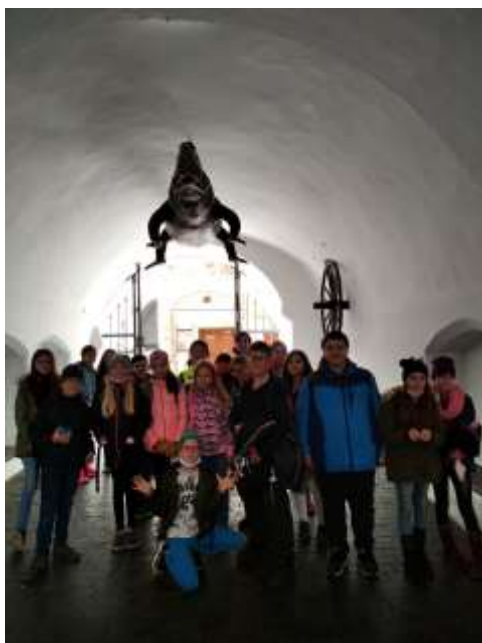
NÁVŠTĚVA PLANETÁRIA A BRNA