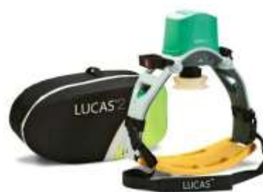
PŘÍSTOJ NA SRDEČNÍ MASÁŽ LUCAS 2