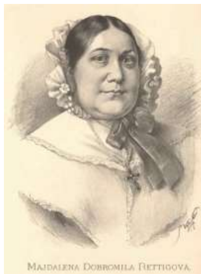
MAGDALENA DOBROMILA RETTIGOVÁ

Narodila se 31. ledna 1785 ve Všeradicích. Maminka byla Češka a otec Němec. Bohužel v dětství přišla jak o otce, tak o sourozence. Sama s matkou se přestěhovala do Plzně. Magdaléna byla velmi chytrá a měla zájem se učit. Nejdříve ji matka vyučovala sama a v deseti letech ji poslala do školy. Poté se znovu stěhovaly k tetě do Prahy. Magdaléna neuměla česky, vlastenecká buditelka se z ní stala až po její svatbě s českým spisovatelem Janem Aloisem Rettigem v jejích 18 letech. Manžel ji neobyčejně v její činnosti podporoval, sháněl jí zkušené rádce a její tvorbu příležitostně uveřejňoval se svými básněmi. Magdaléna vychovávala mladé dívky, předčítala jim české knihy, zasadila se o prospěšné činnosti, např. o vyčištění studánky v Litomyšli. Také vedla společenský salon Kafičková společnost a dopisovala si s vlastenci, např. s Josefem Jungmannem. Mezi její literární tvorbu patří např. Kafičko, Bílá růže nebo Chudobičky. Zemřela 5. srpna 1845.