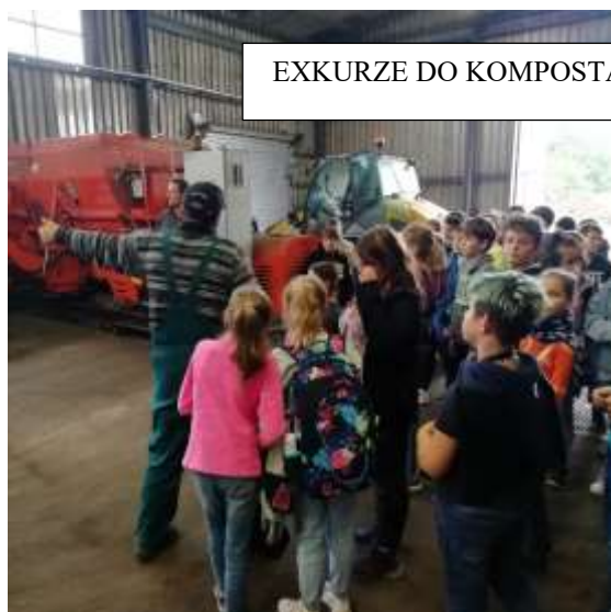
EXKURZE DO KOMPOSTÁRNY