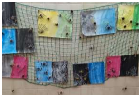
OSMÁCI KRESLILI SVÉ KARTY OSUDU