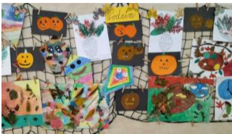
PODZIMNÍ VÝZDOBA NA PRVNÍM STUPNI