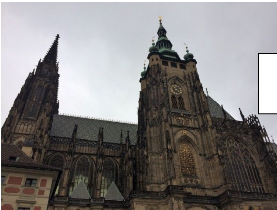
...Katedrála sv. Víta, Václava, Vojtěcha...